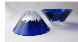
TG13-013-1B 彫刻硝子青富士(1ヶ木箱入り) ¥4,000(税抜き) 箱サイズ:102×102×H50mm