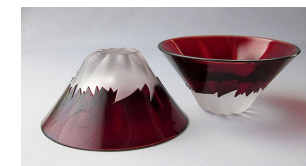
TG13-013-1R 彫刻硝子赤富士(1ヶ木箱入り) ¥4,000(税抜き) 箱サイズ:102×102×H50mm