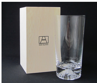
TG15-015-T ¥5,000(税抜き) タンブラー / 口径76×高さ150mm 箱サイズ / 90×170×88mm

ガラス職人の手技が冴える伝統技法で世界遺産の富士山をグラスの底に入れました。 ウイスキー、カンパリ、ブランディー、カルーア、etc・・・ 飲み物によって色の違う富士山が見えますから、何をどうして飲んでみようかと迷う愉しみも・・・。 光と影で彩りを変えてゆく、グラスの中の富士山をゆると眺めながら、心に残る時間をお過ごし下さい。