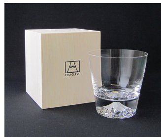
TG15-015-R ¥5,000(税抜き) ロックグラス / 口径92×高さ95mm 箱サイズ / 105×100×102mm