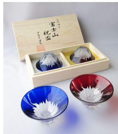
TG13-013-2 彫刻硝子青赤富士セット(木箱入り) ¥8,000(税抜き) 箱サイズ:100×192×H50mm

第54回(平成25年度) 全国推奨観光土産品審査会 (経済産業大臣賞 / 工芸の部) 大賞・受賞