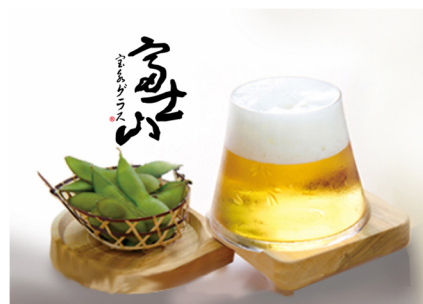
グラスサイズ / φ60 × H77 280cc 箱サイズ / 110 × 110 × 111

味わい深い「宝永火口」のくぼみと 「富士さくら」の切子をあしらいました。 くぼみには親指が入り、切子部分は 滑り止めにもなります。